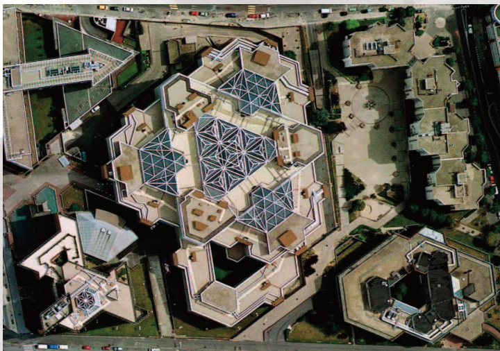
Montreuil - La C.G.T.

Participation de l'Atelier LE GOAS dans les interventions à l'exportation d'ATURBA, reconnu comme expert en Préfabrication Ouverte par l'UNIDO en Yougoslavie et Algérie.