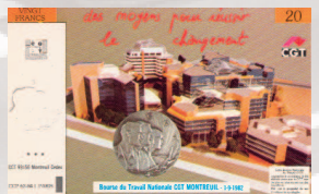
La vie ouvrière 1982